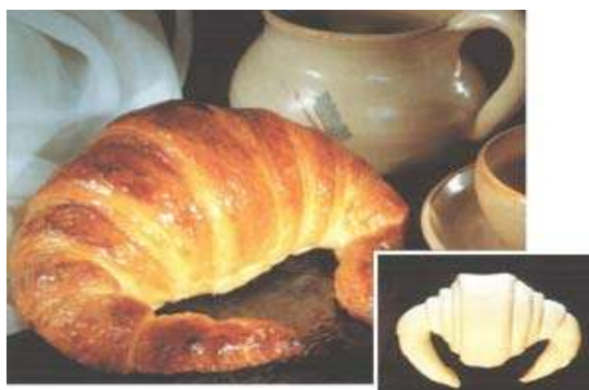
Producto listo para el consumo

También es importante destacar que, dentro de la industria de la panificación, los consumidores valoran la calidad artesanal de este tipo de productos. Las empresas industrializadoras deben tratar de conservar estas cualidades. Como lo revelan diversos estudios de mercado, el pan de molde industrializado no es un sustituto del pan artesanal horneado en las panaderías y para poder llegar a competir con éstas los industriales cuentan en este momento con la tecnología de la ultracongelación que aplicada a las masas posibilita el desarrollo de panes congelados con características sorprendentemente similares a las del pan artesanal recién horneado. Además de la correcta tecnología de congelación, es necesario aplicar durante la elaboración de los panificados ultracongelados técnicas adecuadas que hacen a la obtención del producto deseado y aditivos alimentarios especiales para masas congeladas desarrollados por la ingeniería alimentaria.