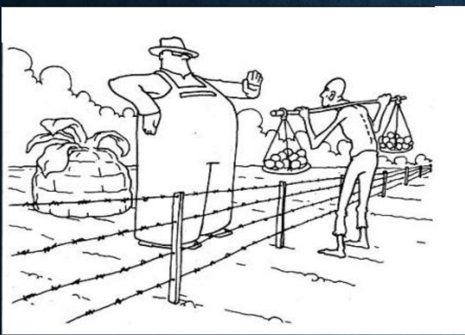
Desigualdad económica de lo social