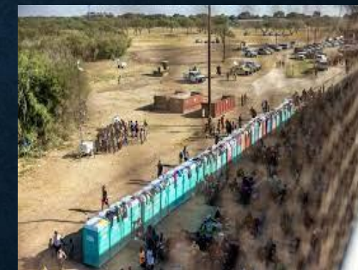
Represión en la frontera EEUU a migrantes haitianos