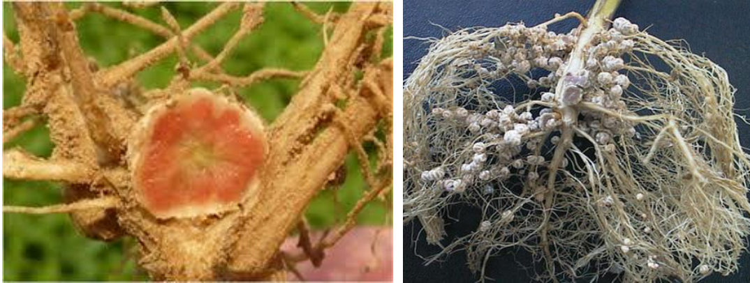
Figura 2: Nódulos efectivo