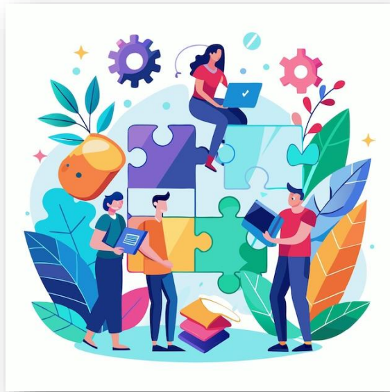
CLASE PRÁCTICA: LUNES DE 14 A 16 HS.