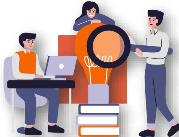
CLASE TEÓRICA: VIERNES DE 10 A 12 HS.