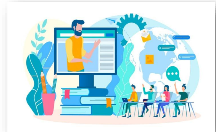
AULA VIRTUAL: ACTIVIDADES ASINCRÓNICAS